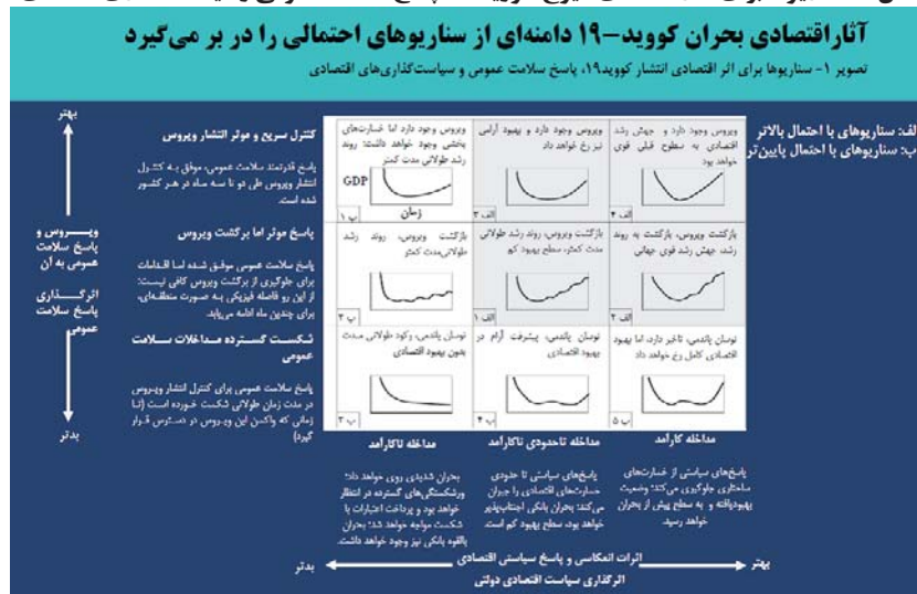
شکل ۳- سناریوها برای آثار اقتصادی شیوع کووید ۱۹؛ پاسخ سلامت عمومی و سیاست‌گذاری اقتصادی

پیش‌بینی مدیریت سلامت و اقتصاد در شرایط کرونا به این بستگی دارد که ویروس چگونه گسترش می‌یابد و جامعه چگونه به شیوع آن پاسخ می‌دهد و مداخلات در حوزه سلامت و اقتصاد، چقدر کارآمد و به‌هنگام است. برای بررسی بهتر اینکه چه باید کرد، سناریوهایی را که مکنزی طراحی کرده، به کار می‌بریم. در این سناریوها، دو محور عدم قطعیت ویروس و پاسخ سلامت عمومی به آن و اثرگذاری پاسخ عمومی از یکسو و اثرات انعکاسی و پاسخ سیاستی اقتصادی و اثرگذاری سیاست اقتصادی دولتی از دیگر سو، نه سناریو را به دست می‌دهد. این سناریوها در شکل ۳ آورده شده است.