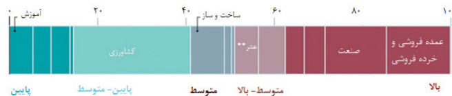
شکل ۱- نمودار کارگرانی که اکنون مشغول به کار نیستند؛ بر آورد اثر بحران کووید ۱۹ بر خروجی اقتصاد؛ درصد اشتغال بر حسب بخش‌های اقتصادی، آوریل ۲۰۲۰

(سازمان بین‌المللی کار، ترجمه شده از نشریه اکونومیست، ۱۱ آوریل ۲۰۲۰)