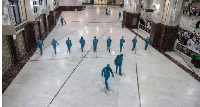
تصویر ۸: صحن حرم رضوی در ایام کرونایی (مشهد)