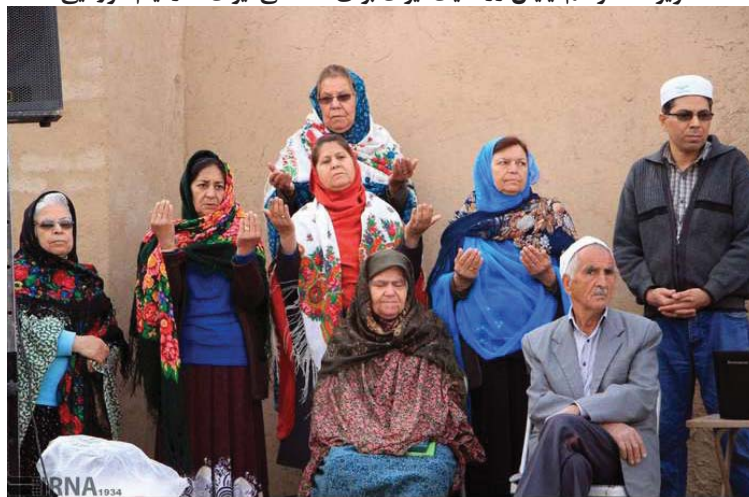
تصویر ۱۵: مراسم نیایش زرتشتیان ایران برای «سلامتی ایران» در ایام کروناپی

- برگزاری جشن زایش آشو زرتشت در تهران: «... به مناسبت خجسته زادروز آشو زرتشت، نخستین پیام آور ایرانی، ششم فروردین ماه در همایشگاه فرهنگی مارکار تهرانپارس با باشندگی شماری از هم‌کیشان و مسئولان هازمان زرتشتی برگزار شد. سخنرانی فرنشین انجمن زرتشتیان تهران، شاهنامه‌خوانی و اجرای