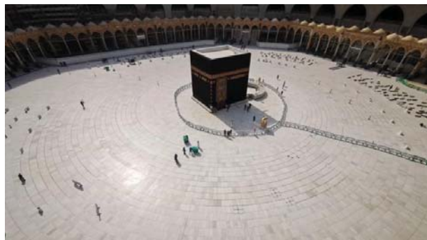
تصویر ۶: بیت الله الحرام (کعبه) در ایام کرونایی

در گزارش الجزیره، درباره نحوه تأثیر کرونا بر اجرای شعایر دینی در دو زیست جهان تسنن و تشیع بحث شده است که تمرکز آن به صورت تصویری و مستند بر تعطیلی «شعایر آیینی نماز و زیارت» در هر دو زیست جهان (آیین «حج» در مکه و زیارت مدینه در عربستان؛ «زیارت» عتبات عالیات در نجف، کربلا، کاظمین و سامرا در عراق و نیز حرم رضوی در ایران) است.