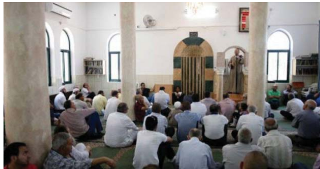
تصویر ۹: مسجدی در فلسطین (رام‌الله) در ایام کرونایی

- اعلام فتوای مجمع علمای مغرب (مراکش) مبنی بر لزوم «توقف نمازهای جمعه» و «بسته شدن مساجد» به لحاظ اهمیت شرعی حفظ حیات اجتماعی - سیاسی مسلمانان و بسته ماندن مساجد این کشور تا رفع کرونا (سایت وزاره الاوقاف و الشئون اسلامیه للملکه المغرب، الاربعاء ۱۸ مارس ۲۰۲۰). - دعوت وزارت امور دینی الجزایر از علمای دین برای روشنگری عالمانه و مطمئن نسبت به ضرورت شرعی «تعطیلی نمازهای جمعه» و «بسته شدن موقتی مساجد» برای حفظ سلامتی مسلمین و تداوم حیات اجتماعی سیاسی مردم الجزایر (سایت وزاره الشئون الدینیة و الاوقاف للملکه الجزایر، الثلاثاء - مارس ۲۴ - ۲۰۲۰). - فتوای مجمع علمی - دینی علمای اهل سنت درباره اهمیت شرعی «بسته شدن موقتی مساجد» و «تعطیلی اماکن عمومی» و «تعطیلی موقتی نمازهای جمعه» با هدف حفظ جان مسلمین (سایت وزاره الاوقاف و الشئون اسلامیه للملکه المغرب، الثلاثاء ۲۹ رجب ۱۴۴۱ هـ الموافق ۲۴ مارس ۲۰۲۰).